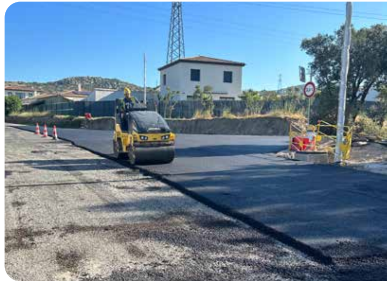
Travaux de la route d'Aurons

Et pour que notre ville fleurie continue d'être verte, ce sont 16 arbres qui seront plantés le long de la route d'Aurons cet automne.