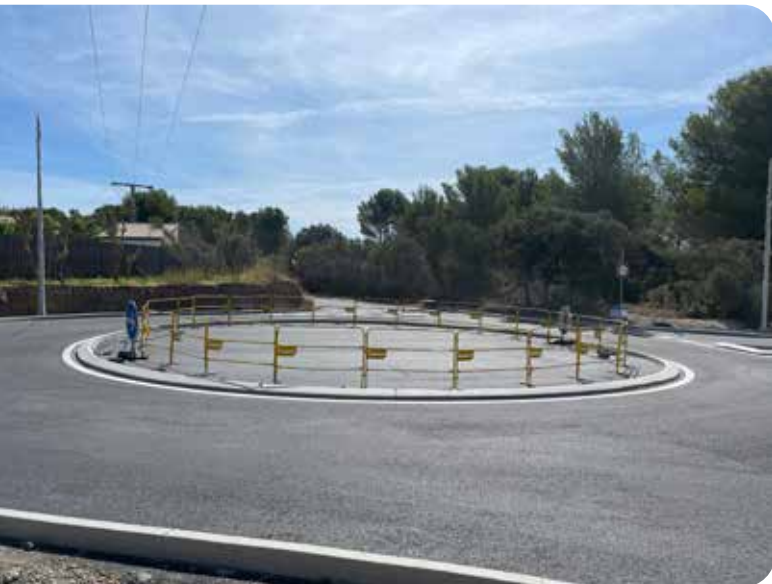
Création d'un rond-point route d'Aurons

La requalification des voies aux normes actuelles permet de garantir la sécurité des différents usagers (piétons, fauteuil, poussettes, vélos,...) grâce à la création de trottoirs, pistes cyclables, zones de rencontre.