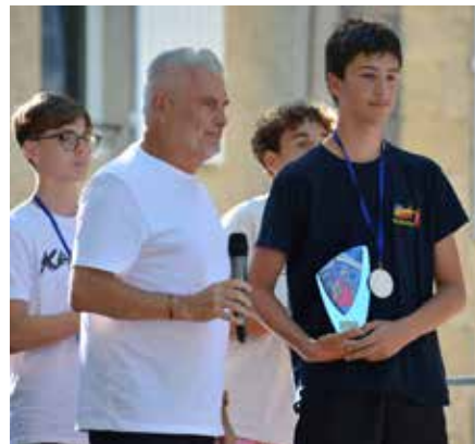
Fête populaire du 13 Juillet