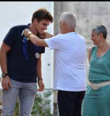
Soirée des sports - 1er Juillet