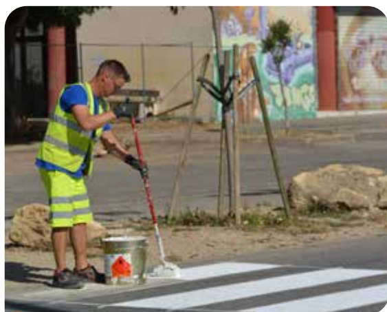
Rénovation des signalisations routières horizontales

Embellir la ville, c'est promouvoir son cadre de vie, protéger l'environnement et la biodiversité. C'est également soutenir son dynamisme, favoriser la cohésion sociale et valoriser l'accueil de nos visiteurs. C'est pour cela que nous continuons cette démarche d'embellissement perpétuel.