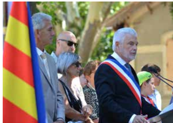
Festival de la Roque d'Anthéron - 14 Août