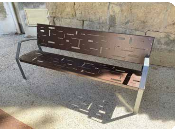
Installation de bancs, Rue de la République

Embellir la ville, c'est promouvoir son cadre de vie, protéger l'environnement et la biodiversité. C'est également soutenir son dynamisme, favoriser la cohésion sociale et valoriser l'accueil de nos visiteurs. C'est pour cela que nous continuons cette démarche d'embellissement perpétuel.