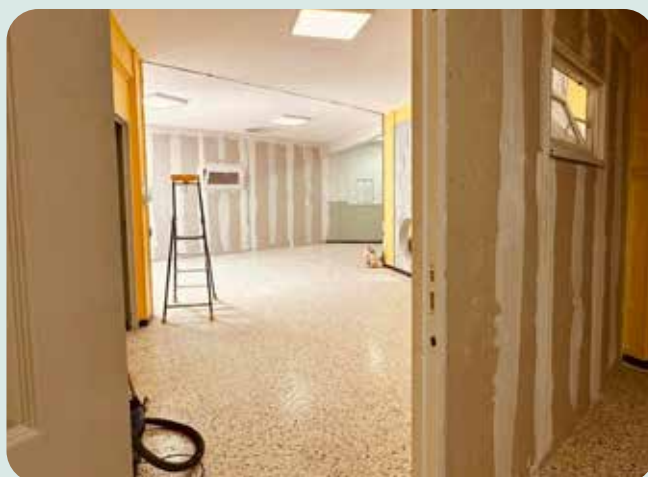
Travaux de la nouvelle salle des maîtres