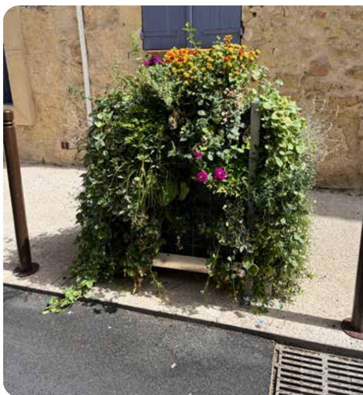
Création de murs végétaux dans la Ville