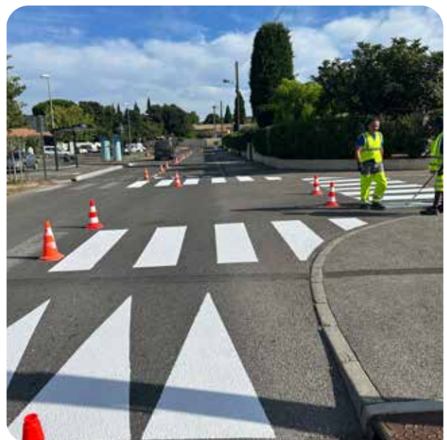
Rénovation des signalisations routières horizontales

La rénovation des signalisations routières horizontales contribue aussi à la sécurisation de la circulation sur la zone. Elles permettent d'améliorer la compréhension et le respect des règles de conduite.