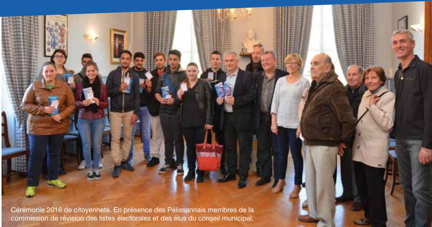
Cérémonie 2016 de citoyenneté. En présence des Pélissannais membres de la commission de révision des listes électorales et des élus du conseil municipal.