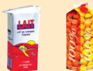
Briques alimentaires :