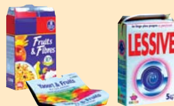
Emballages cartonnés :