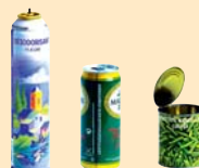
Emballages métalliques :