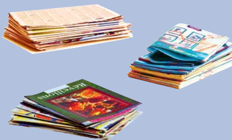
Journaux, prospectus, magazines :