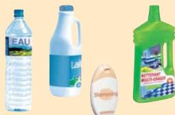
Bouteilles et flacons en plastique :